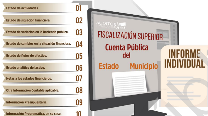
Diagrama 2 Enfoque a Procesos de la Fiscalización Superior 2017

“2019, Año del Caudillo del Sur, Emiliano Zapata”