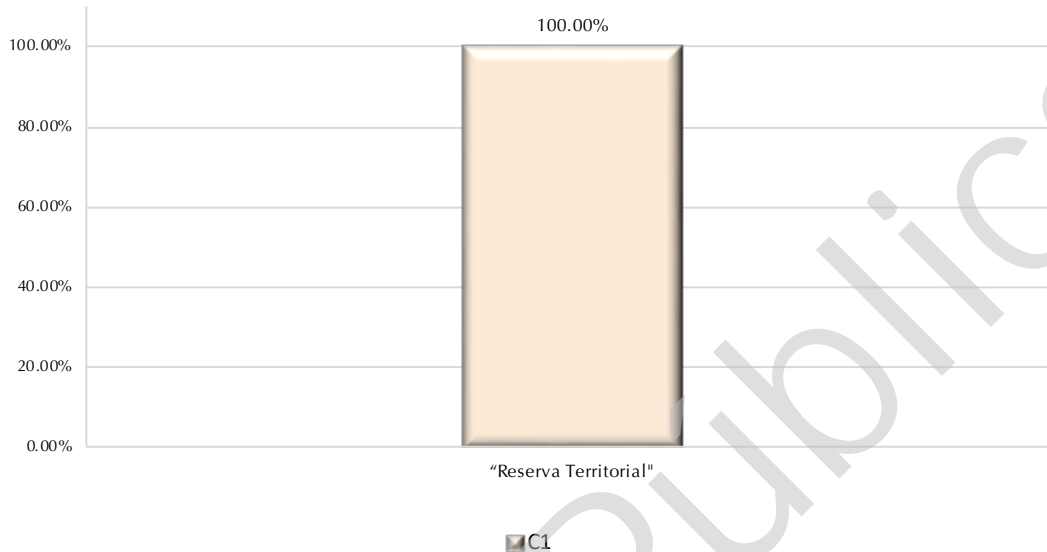
Gráfica 2 Cumplimiento de los Indicadores

“2019, Año del Caudillo del Sur, Emiliano Zapata”