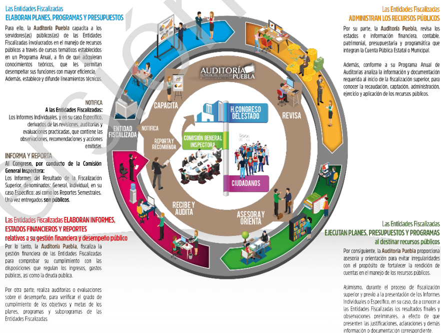
Diagrama 1 Proceso de Fiscalización Superior 2017